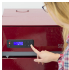
Przyjazny panel sterowania + Wi-Fi w standardzie

Dzięki nowej komorze spalania, pellet zawsze zostanie spalony idealnie, a użytkownik otrzyma małą ilość gładkiego popiołu.