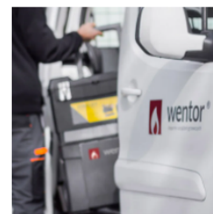
Serwis w całej Polsce

Zapomnij o ciągłych ustawieniach kotła. Urządzenia są już skonfigurowane do pracy, aby spalanie pelletu było najbardziej wydajne.