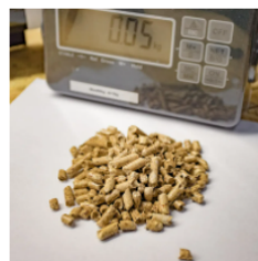
Brak konieczności przeważania

Wymiennik kotła chroniony jest przed zniszczeniem za pomocą specjalnych gumowych tuleji rozprężnych.