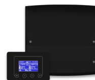
ecoMAX360 sim TOUCH ST4 Separate