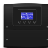
ecoMAX360 sim TOUCH ST4